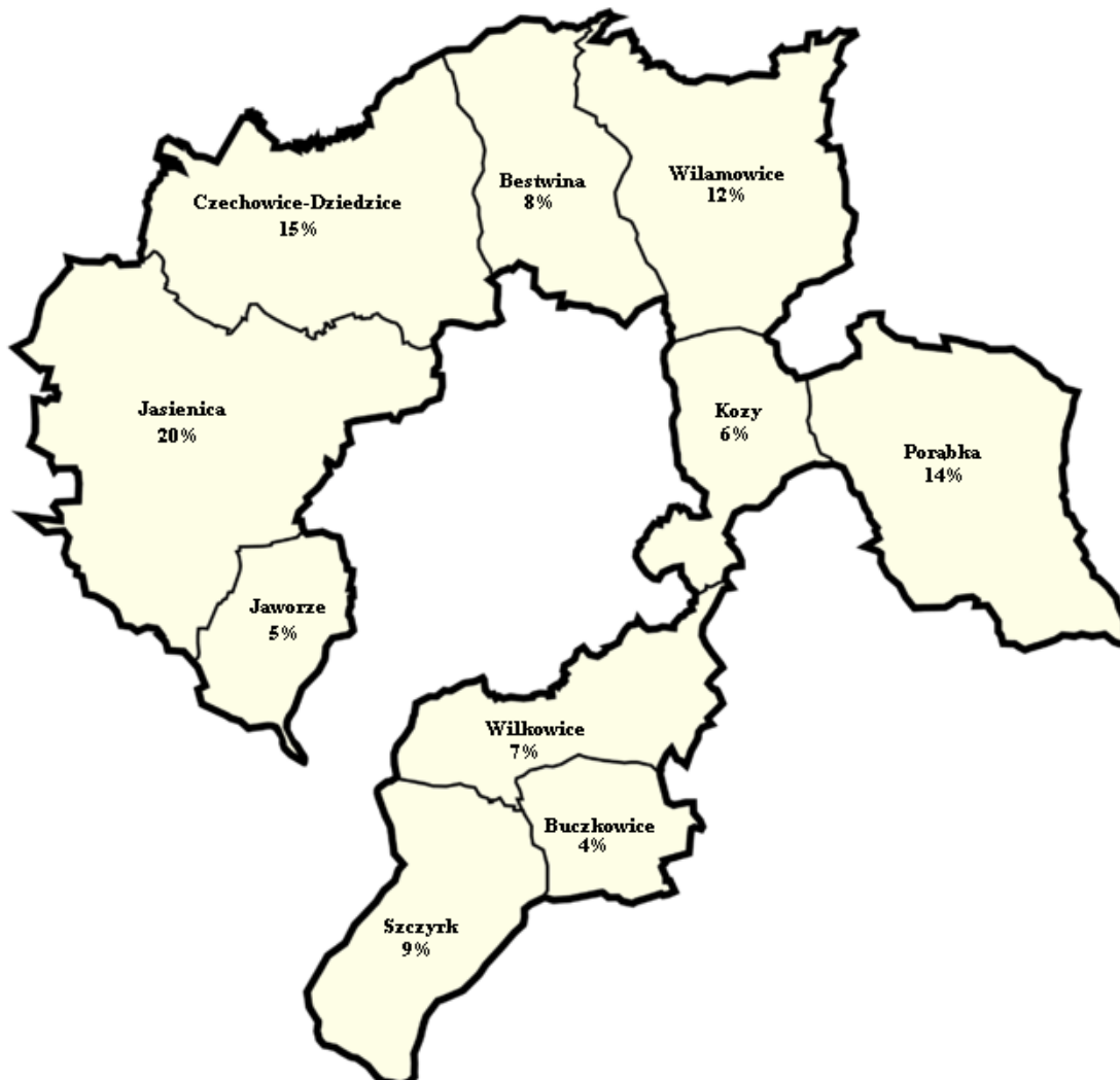
Mapa 3. Powierzchnia poszczególnych gmin na tle powiatu bielskiego.

Poniższe zestawienie prezentuje udział każdej z wymienionych gmin (w procentach) w powierzchni Powiatu Bielskiego ogółem.