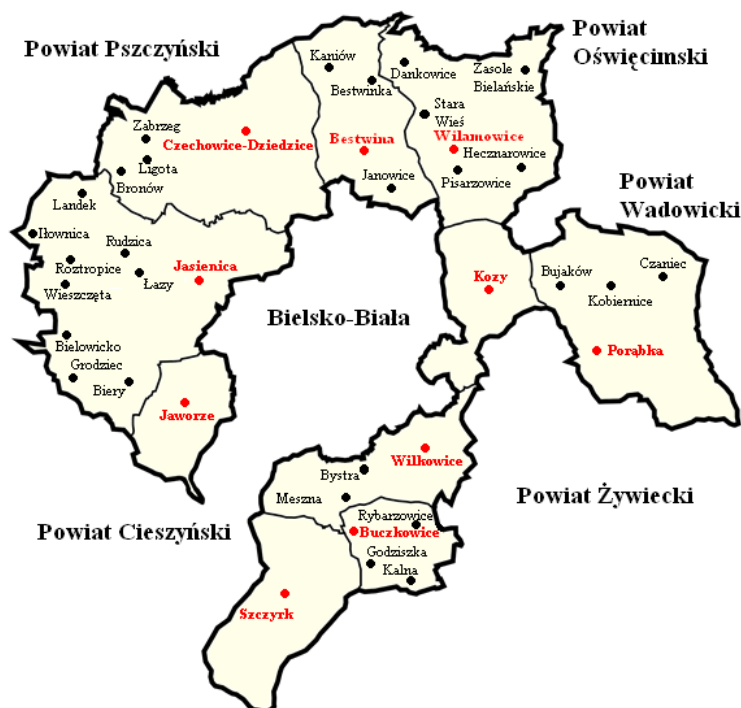
Mapa 2. Położenie powiatu bielskiego na tle regionu.